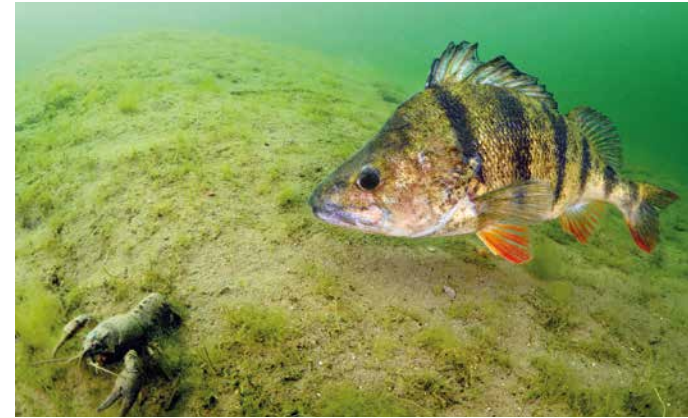
De baars is een predator van exotische rivierkreeften.

Een veelbelovende aanpak van invasieve kreeften combineert beide hoogst gerangschikte beheersscenario's volgens de MCA. Dit omvat enerzijds het vergroten van de robuustheid en veerkracht van aquatische ecosystemen en anderzijds de intensieve commerciële visserij van rivierkreeften met aanvullende kreeftenbevisning door waterschappen en natuurbeheerders – liefst in samenwerking met vrijwilligers (sportvissers) gedurende een lange periode op plaatsen met een hoog risico (bijvoorbeeld gebieden met kwetsbare dijken en oevers) en in kwetsbare of moeilijk toegankelijke waterlopen die niet geschikt zijn voor de commerciële visserij.