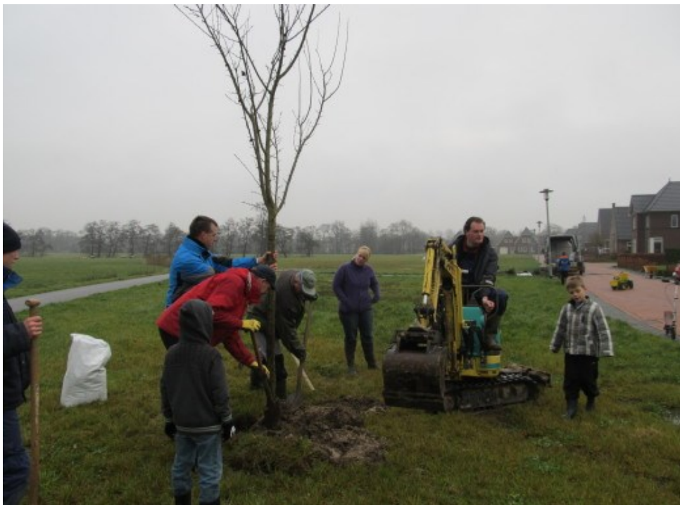
Burgerinitiatief zorgt voor fruitbomen in nieuwbouwwijk van Oldekerk